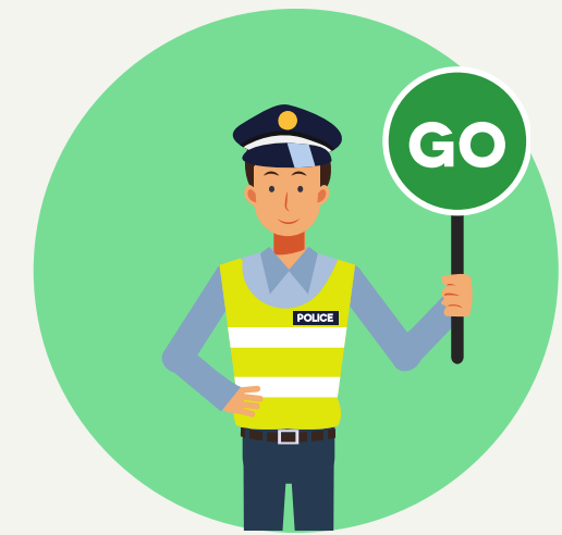
ADDETTI ALLA SOSTA