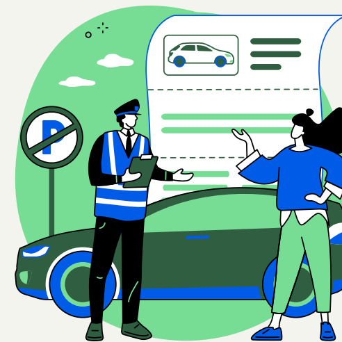
AUSILIARI DEL TRAFFICO

Queste figure saranno formate per ricoprire principalmente due ruoli: